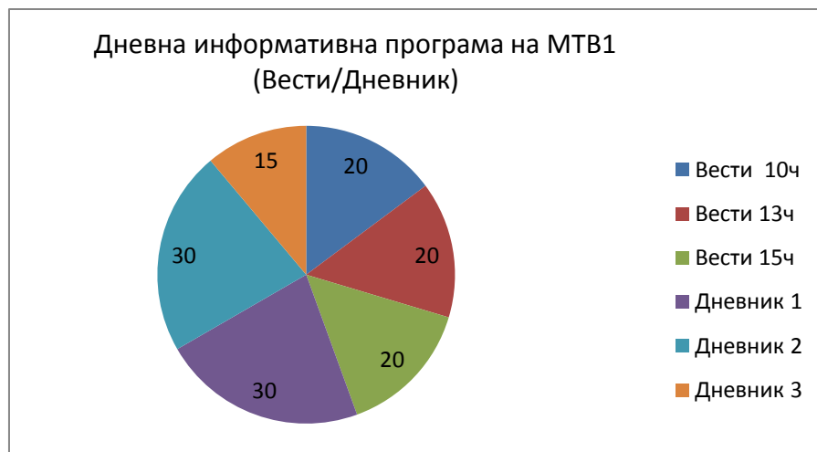
Графикон: Програмски формат на информативни дневни содржини во минути

Првиот програмски сервис на МРТ сè уште го практикува повеќегодишниот (традиционален) формат на емитување три (3) изданија на дневно-информативниот Дневник во текот на денот – попладневен (Дневник 1, 17:00 часот), централен/вечерен (Дневник 2, 19:30 часот) во траење од половина час и скратено доцновечерно издание (Дневник 3, 23:00 часот) од петнаесетина минути. МРТ1 емитува и три (3) изданија на информативната програма Вести, во траење од вкупно 20-ина минути, во термините 10:00, 13:00 и 15:00 часот. Во доцните вечерни часови се емитува и реприза на изданието на Дневник 2, вообичаено околу 1:00 часот по полноќ. Според овој програмски формат, МРТ1 секојдневно треба да емитува 135 минути дневна информативна програма.